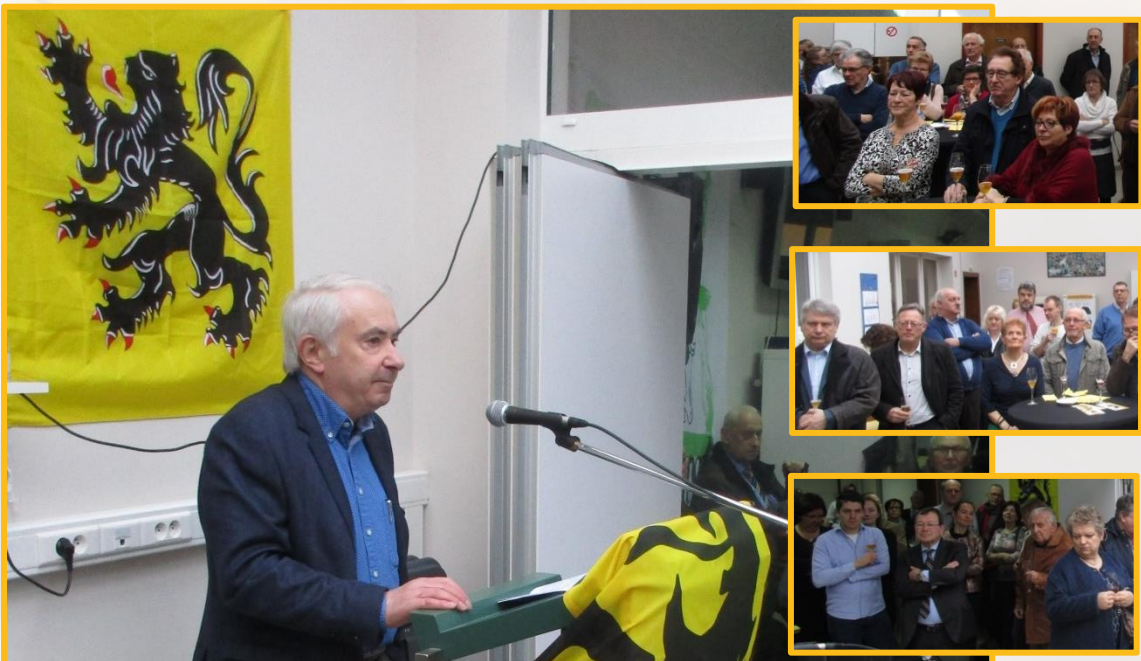
Van Abbeeloos tot Zeppos

Voor deze actuele spreker over streekidentiteit, was er een ruime belangstelling. De nieuwjaarsreceptie werd dan ook opnieuw druk bijgewoond.