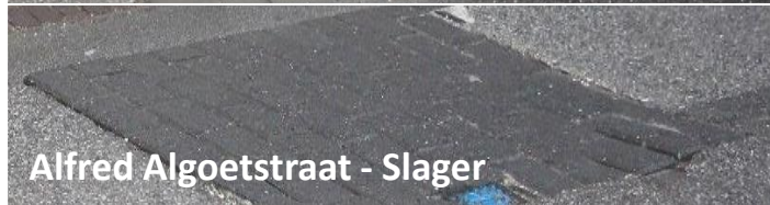
Alfred Algoetstraat - Slager