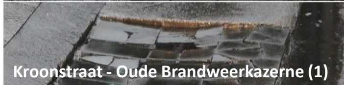
Kroonstraat - Oude Brandweerkazerne (1)