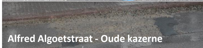
Alfred Algoetstraat - Oude kazerne