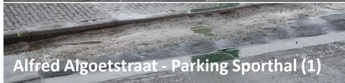
Alfred Algoetstraat - Parking Sporthal (1)