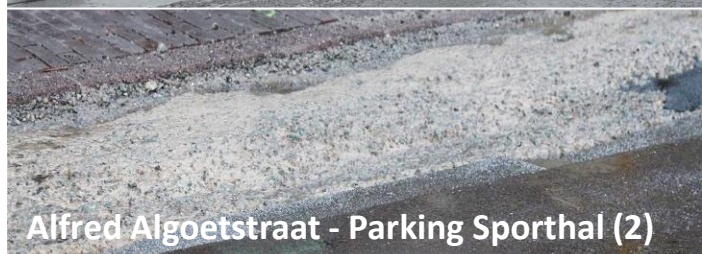
Alfred Algoetstraat - Parking Sporthal (2)