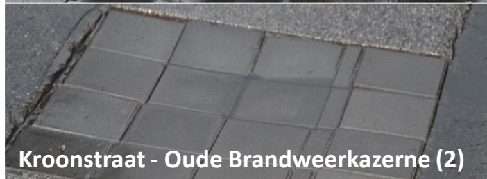
Kroonstraat - Oude Brandweerkazerne (2)