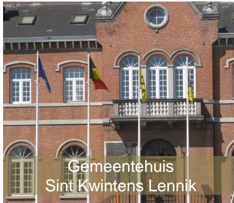
Gemeentehuis Sint Kwintens Lennik