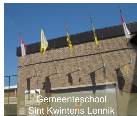
Gemeenteschool Sint Kwintens Lennik