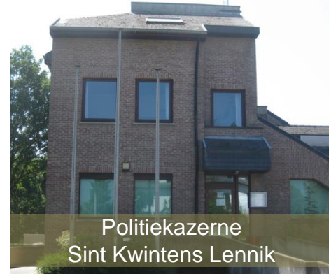
Politiekazerne Sint Kwintens Lennik