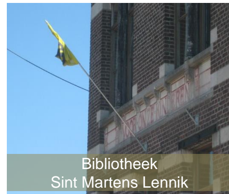
Bibliotheek Sint Martens Lennik