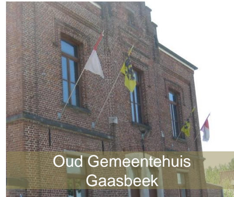
Oud Gemeentehuis Gaasbeek

Voor sommigen is 21 juli gewoon een verlofdag, voor royalisten een hoogdag, voor republikeinen een dag om snel te vergeten. Elk heeft zijn voorkeur en die respecteren we ook.