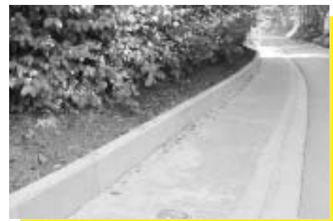
Koestraat (St-Mart.-Lennik) Plaatsing boordsteen en taludverbetering