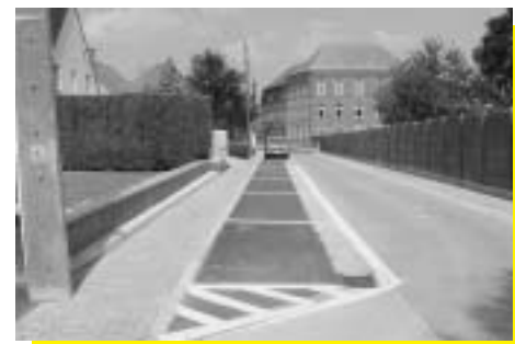
Luit. Jacopsstraat herstelling en belijning

In vorige nummers vermeldden we reeds dat herstellings- en verbeteringswerken zouden uitgevoerd worden aan een hele resem straten in de gemeente (Cothemstraat, Korte Rosweg, Steenstraat, Espenhoutstraat, Binnenweg, Kattelauw, Opperbusingenstraat, Luitenant Jacopsstraat, Frans Baetensstraat, Processiestraat, .....).