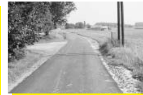
Oude Brusselsestraat na herstelling