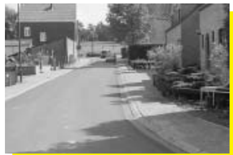
Frans Baetensstraat na herstelling