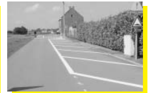
Processiestraat belijning parking