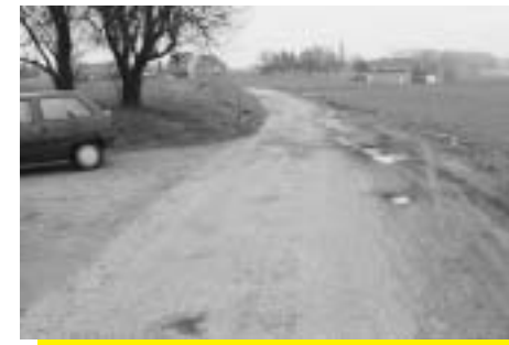
Oude Brusselsestraat voor herstelling

Naar aanleiding van het 20-jarig bestaan van de gemeentelijke bibliotheek zullen de trouwe bezoekers op 16 oktober tijdens de landelijke verwendag een kleine attentie ontvangen.