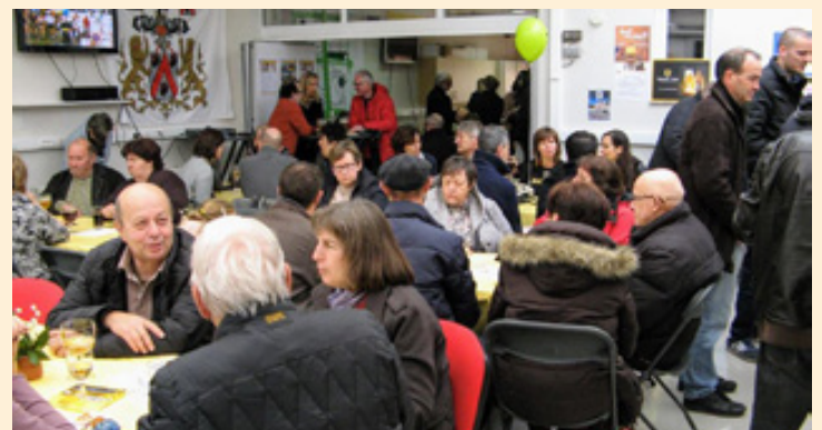
▲ Recordopkomst in ons gezellig Jaarmarktcafé!

Volgend jaar bent u natuurlijk opnieuw welkom!