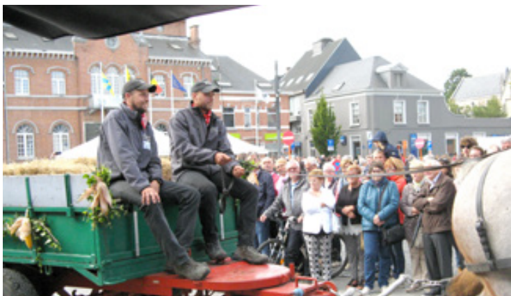
▲ "25 jaar Prins" heeft Lennik weer op de kaart gezet