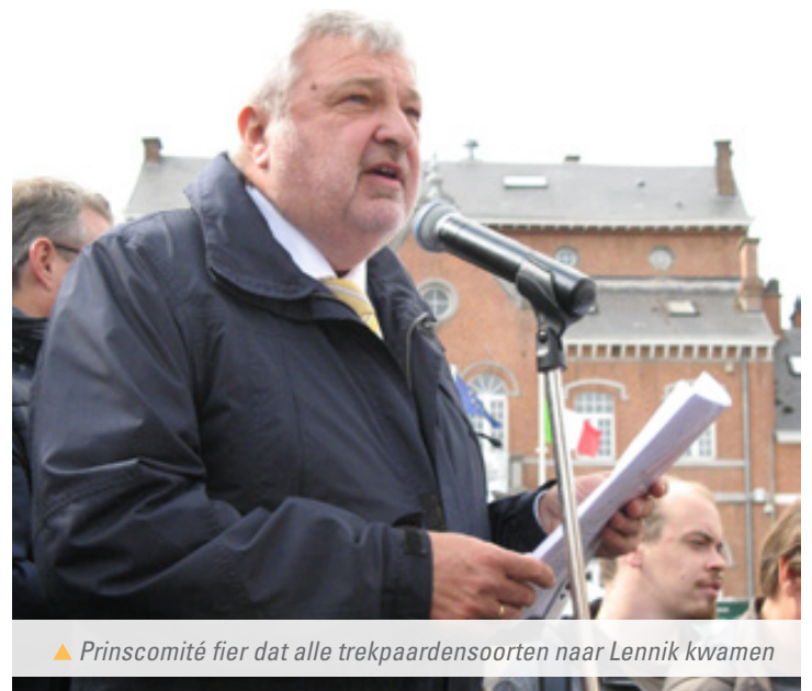
▲ Prinscomité fier dat alle trekpaardensoorten naar Lennik kwamen

Als openers kwamen toen de vendeliers van oud-KLJ hun kunnen tonen. Daarna de koets met prominenten : ereburgemeester Etienne Van Vaerenbergh (onder wiens bestuur Prins er kwam, en Prins-comitélid), schepen voor cultuur Van Ginderdeuren, én net als 25 jaar geleden de Vlaamse Minister van Cultuur, nu minister Gatz, die - notabene op nationale Open Monumentendag (!) - uitgerekend naar Lennik wilde komen getuigen hoe belangrijk 'immaterieel' erfgoed als traditie kan zijn. Een sterke zet van het Prinscomité om deze eregast te strikken.