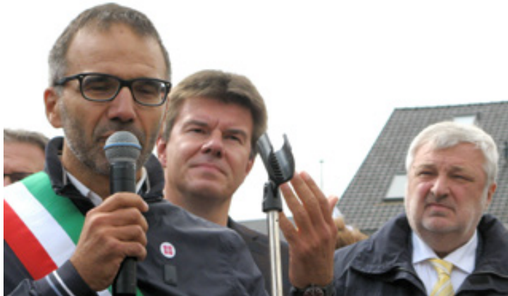
▲ Nationaal en internationaal bezoek voor Prins