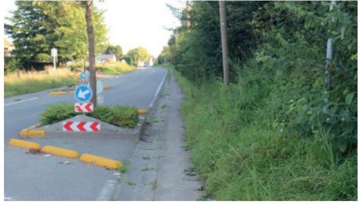
▲ Onvoldoende onderhoud fietspaden

Ook al gemerkt dat Lennik vervuult? Ondanks dat de meerderheid wil laten uitschijnen dat wij dit zouden verwijten aan het uitvoerende personeel, ligt dit niet aan deze mensen maar wel aan het huidige beleid. Immers, is dit niet de verantwoordelijkheid van de schepenen en bij uitbreiding het College? Feit is dat de week volgend op onze actie plotseling de verschenen foto's van "vuile" hoekjes waren verholpen!