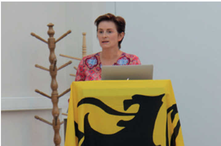
▲ De cijfers: al 3 jaar te weinig daadkracht in Lennik