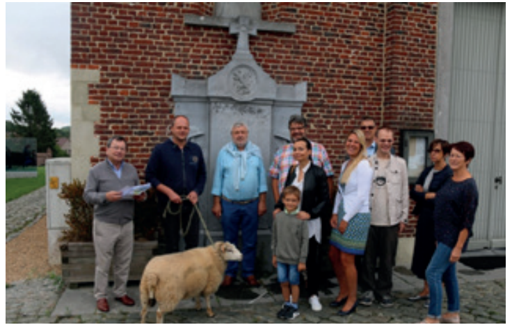
▲ Ludieke actie voor beter groenonderhoud dorpskernen, pleinen, wegen, en begraafplaatsen